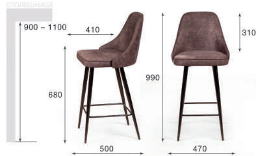
Стул полубарный Oliver