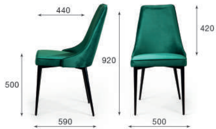
Стул обеденный Oliver