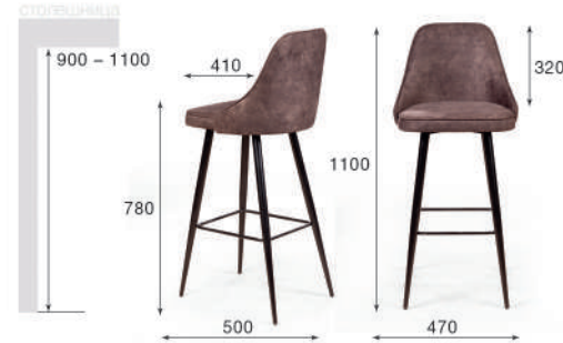
Стул барный Oliver